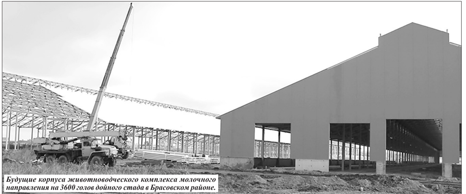
Будущие корпуса животноводческого комплекса молочного направления на 3600 голов дойного стада в Брасовском районе.

В скором времени на территории Брянской области на ещё одно подобное современное молочное производство станет больше – в Брасовском районе за-