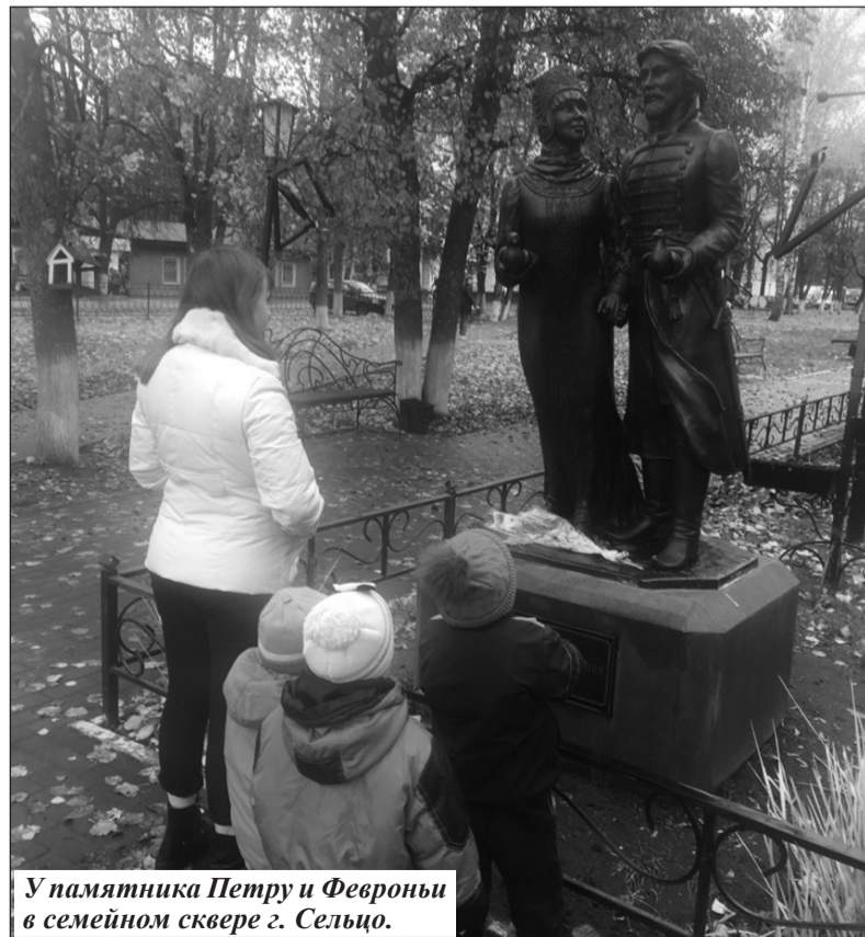
У памятника Петру и Февронье в семейном сквере г. Сельцо.