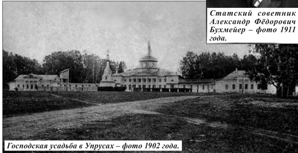
Господская усадьба в Упрусах – фото 1902 года.

На одном из интернет-сайтов глобального культурно-познавательного проекта «Русские